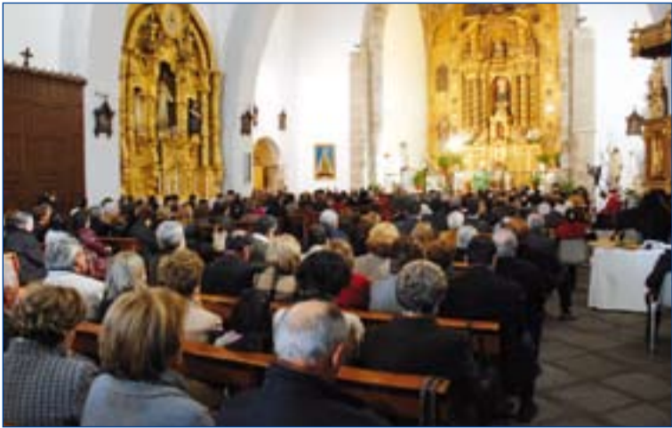
Participantes en el encuentro, durante la celebración de la Eucaristía.

Más de 400 miembros de juntas directivas de hermandades y cofradías se dieron cita en el XVIII encuentro organizado por la Delegación episcopal para las Hermandades, Cofradías y Religiosidad Popular, que este año se celebró en Cabeza del Buey.