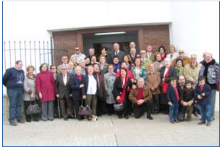
Participantes de la ultreya celebrada en Zafra.

El pasado fin de semana se celebraron en diferentes localidades cuatro ultreyas del Movimiento de Cursillo de Cristiandad: La Garrovilla, Salvaleón, Zafra y Badajoz (esta última en la parroquia de San Andrés). Se da la circunstancia de que la ultreya de Salvaleón es la primera que se celebra en esta localidad. En total se movilizaron entre las diferentes ultreyas cerca de 150 personas.