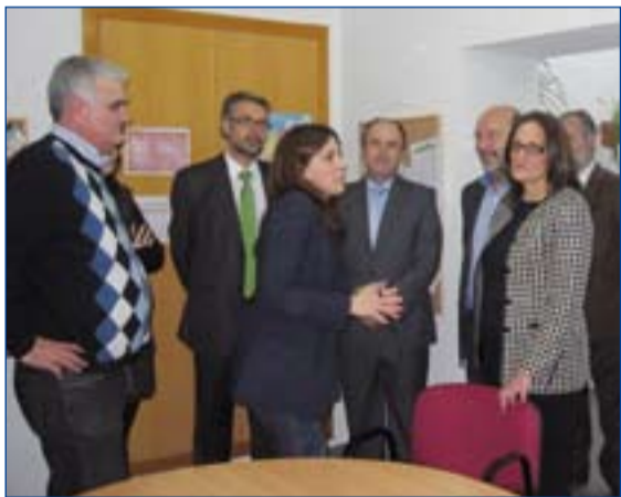
Nuria Espí (dcha), en su visita a Proyecto Vida.

Con motivo de su participación en el II Congreso nacional de Adiciones de Extremadura, Nuria Espí de Navas, Delegada del Gobierno para el Plan Nacional de Drogas, visitó nuestra región y entre las visitas a distintas instituciones se interesó de manera especial por conocer los distintos proyectos del programa de prevención de Proyecto Vida. Acompañada por el Director General de Salud Pública y el Secretario Técnico de Drogodependencias,