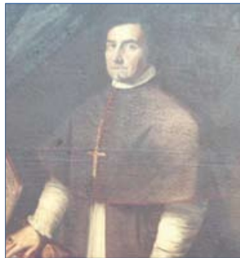
Uno de los abades de la Colegiata.

El final de la Colegiata de Zafra fue debido a la falta de recursos por parte de los Duques de Feria en su original patronato,