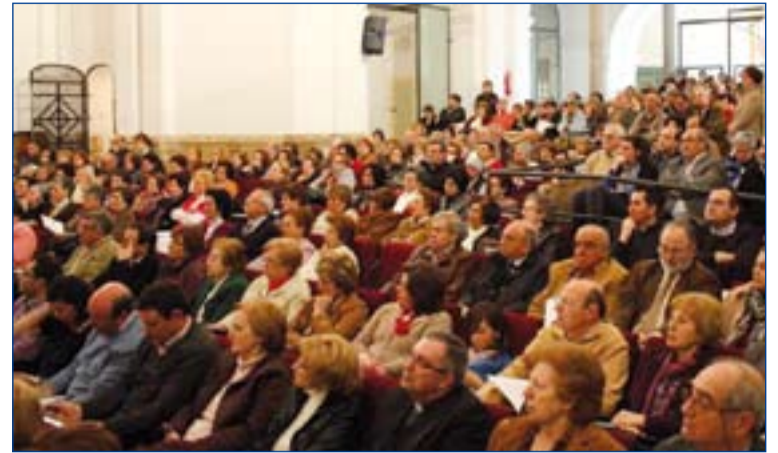
Miembros de las Cáritas parroquiales en la Asamblea diocesana.

En términos generales, hemos notado un aumento en las donaciones, especialmente en especie (de alimentos), una cuantía bastante grande procedente del Banco de Alimentos, y, en general, las personas son más