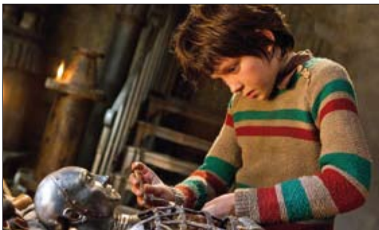
Fotograma de La invención de Hugo .