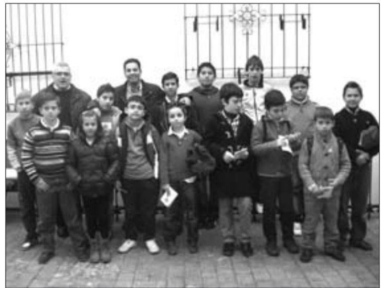
Niños que participaron en la convivencia vocacional.

Todos los niños se marcharon con el deseo y la ilusión de tomar parte en el Encuentro Diocesano de Monaguillos y en las distintas actividades que viene organizando la Delegación Diocesana de Pastoral Vocacional.