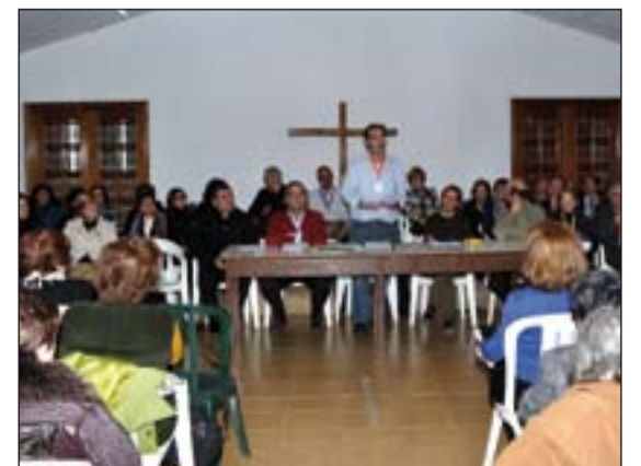
Clausura del Cursillo de Cristiandad nº245.

El sábado 3 y el domingo 4 de marzo se celebrará el encuentro anual de jóvenes.