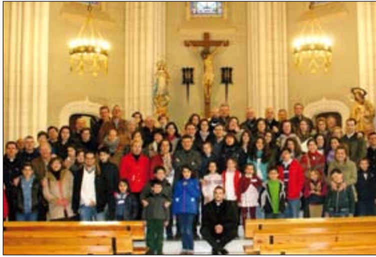
Participantes en los Ejercicios Espirituales.

Durante esta jornada se desarrollaron diferentes actividades comunes, como la comida, la Eucaristía y el Vía Crucis, que prepararon los niños por la mañana.