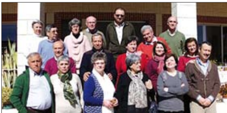
Arriba, grupo de la parroquia de San Juan Bautista y María Auxiliadora. Abajo, grupo de matrimonios de La Serena.

Retiros cuaresmales.- Durante estos días parroquias y grupos de la Diócesis celebran retiros espirituales con motivo de la Cuaresma. Entre ellos, se encuentra un grupo de 80 personas, en su mayoría matrimonios y novios, de la parroquia de San Juan Bautista y María Auxiliadora, en Mérida, que dedicaron una jornada a estar con el Señor y a compartir su fe en la comunidad parroquial.