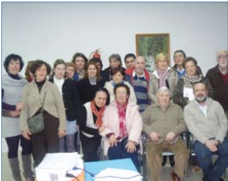
Participantes en este curso de formación.

Los participantes han reflexionado sobre la importancia de la acogida en Cáritas así como sobre las actitudes y habilidades necesarias en la relación de ayuda y el conocimiento de técnicas para realizar con calidad el servicio de acogida. Comprender la importancia de los procesos de acompañamiento ha sido otro de los núcleos centrales de este curso.