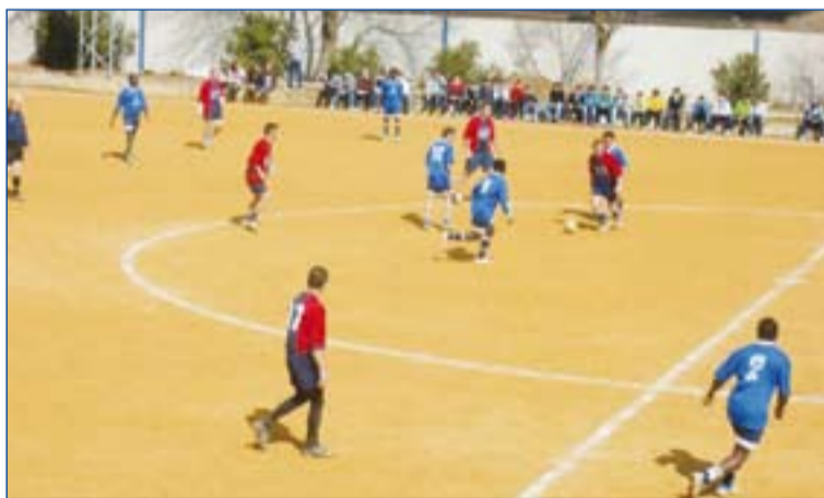
Partido padres y profesores contra selección senegalesa. (Fermi Merino)

ganizado por la Asociación de Padres y Madres “Regiana” del IES “Valdemedel”, se vendieron más de doscientas entradas.