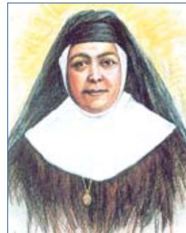
Beata Bonifacia Rodríguez Castro

En la congregación señalan que "esta noticia es motivo de gozo para toda la familia josefina que desea ver reconocida la labor humilde de una mujer que vivió el dolor y el rechazo