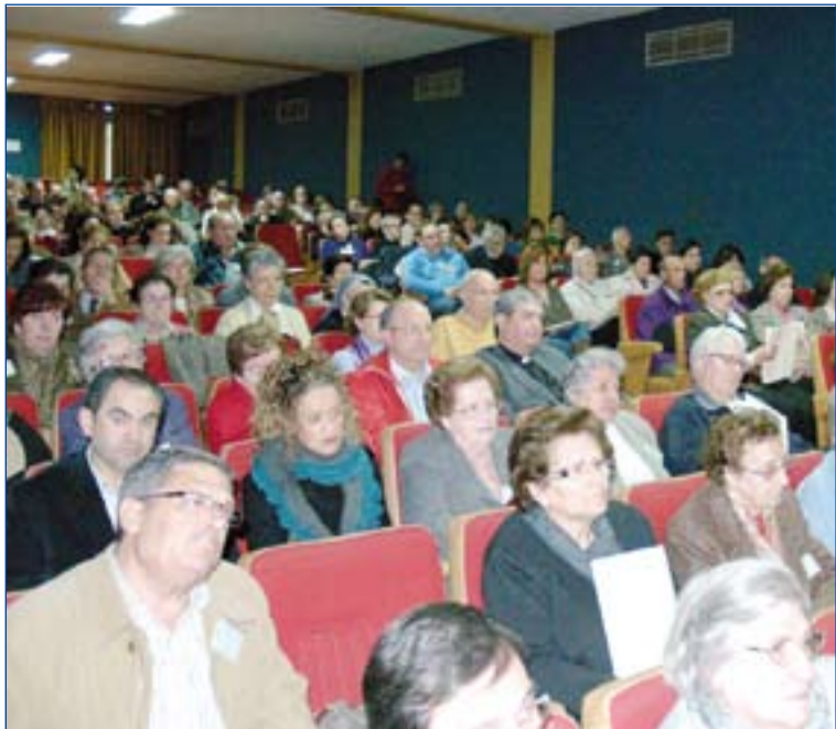
Jornada de reflexión para laicos y sacerdotes.

na y en esta parroquia" y se centra en el perfil del cristiano laico, el laico como protagonista y corresponsable en la tarea de la Iglesia y la misión, mientras que el último de los temas, que llevará por título "Laicos encarnados en el mundo" abundará en la secularidad como espacio del laico, los laicos como testigos del Evangelio y el compromiso laical en la vida pública.