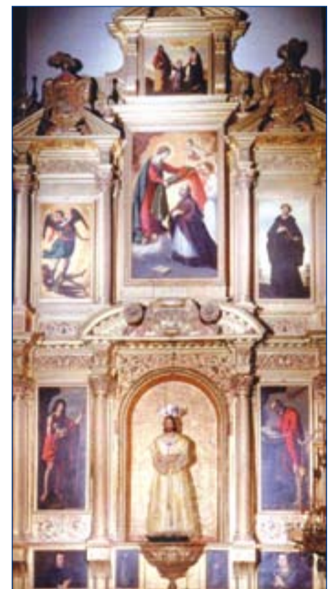
Retablo de Zurbarán.