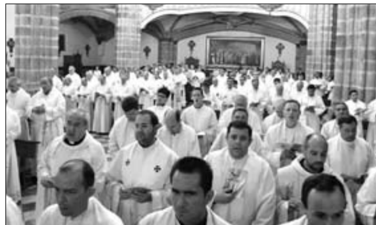
Presbíteros en la apertura del Año Sacerdotal celebrada en Guadalupe.