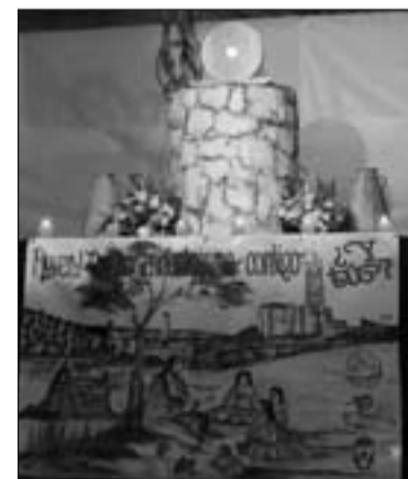
Exposición del Santísimo.

En la misma carta se pide que oremos por el Papa y "por los frutos de su servicio a la iglesia", al mismo tiempo que imparte la Bendición Apostólica para los participantes y organizadores del Encuentro.