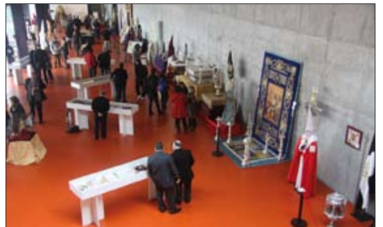
Arriba, asistentes a la ponencia del Arzobispo; abajo, vista genérica de la exposición cofrade.

trabajo" y, por último, "tener una clara conciencia de que forman parte de la Iglesia".