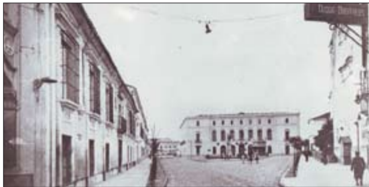
Imagen de la sede del Seminario en San Francisco.

La distribución del edificio que proyectó D. Jerónimo era muy simple. Patio interior no muy amplio; piso bajo con dependencias para servicios comunes, salas de visita y aulas para los diferentes estudios del alumnado y patios distintos para las respectivas comunidades; también comedor, cocina, despensas, bodega, sótano y otras dependencia para uso de los serviciarios y todo con