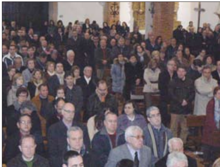
Participantes en el encuentro, durante la Eucaristía.