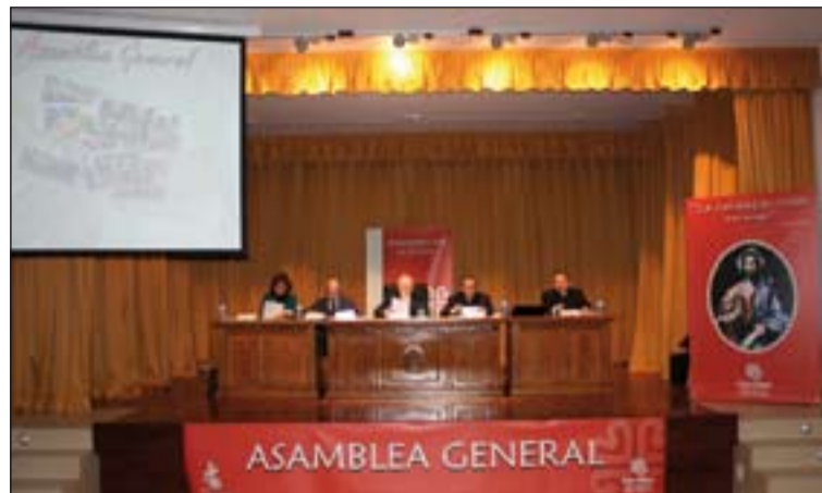
El Arzobispo presidió la Asamblea General.