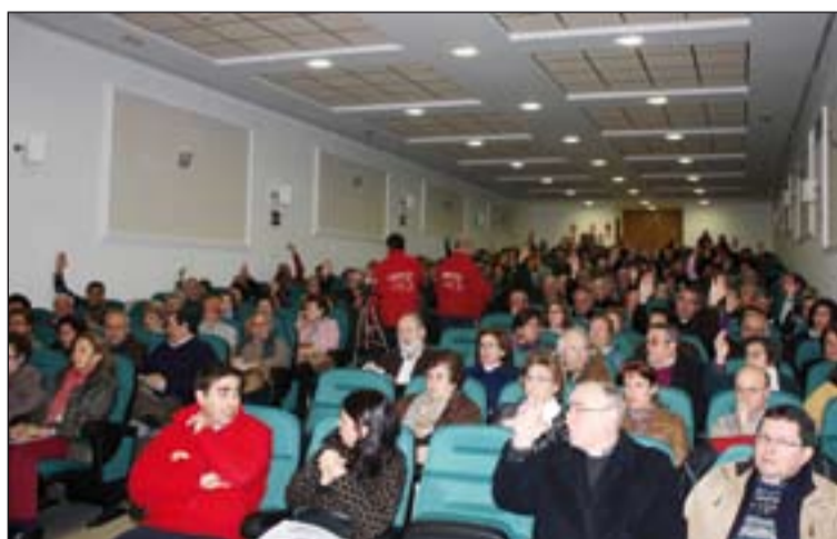
Participantes en la Asamblea durante las votaciones.