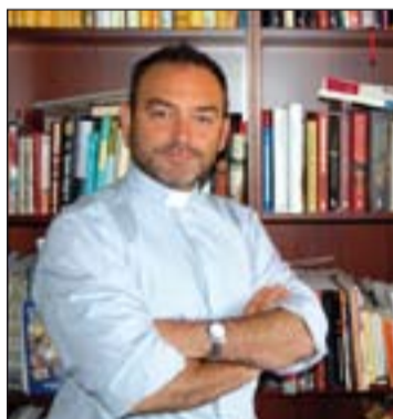
Jesús Sánchez Adalid

Premio ha recaído tanto en autores españoles como hispanoamericanos. Entre ellos encontramos autores como Mercedes Salisachs, Jorge Molist, Almudena de Arteaga, César Vidal, Ángeles de Irisarri o Alberto Vázquez Figueroa, entre otros.