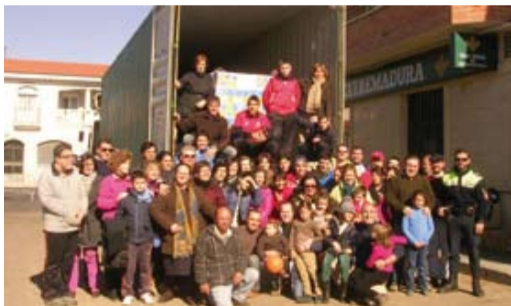
Cuarto contenedor que "Ayúdame a Ayudar" envía a Perú.

La familia misionera de la Asociación "Ayúdame a Ayudar", con sus dos grupos de trabajo en Azuaga y Talavera la Real, se unían el 4 de febrero con un mismo objetivo: llenar un contenedor (el cuarto a Perú), cargado no solo de ayuda humanitaria, que generosamente han ido donando personas e institu-