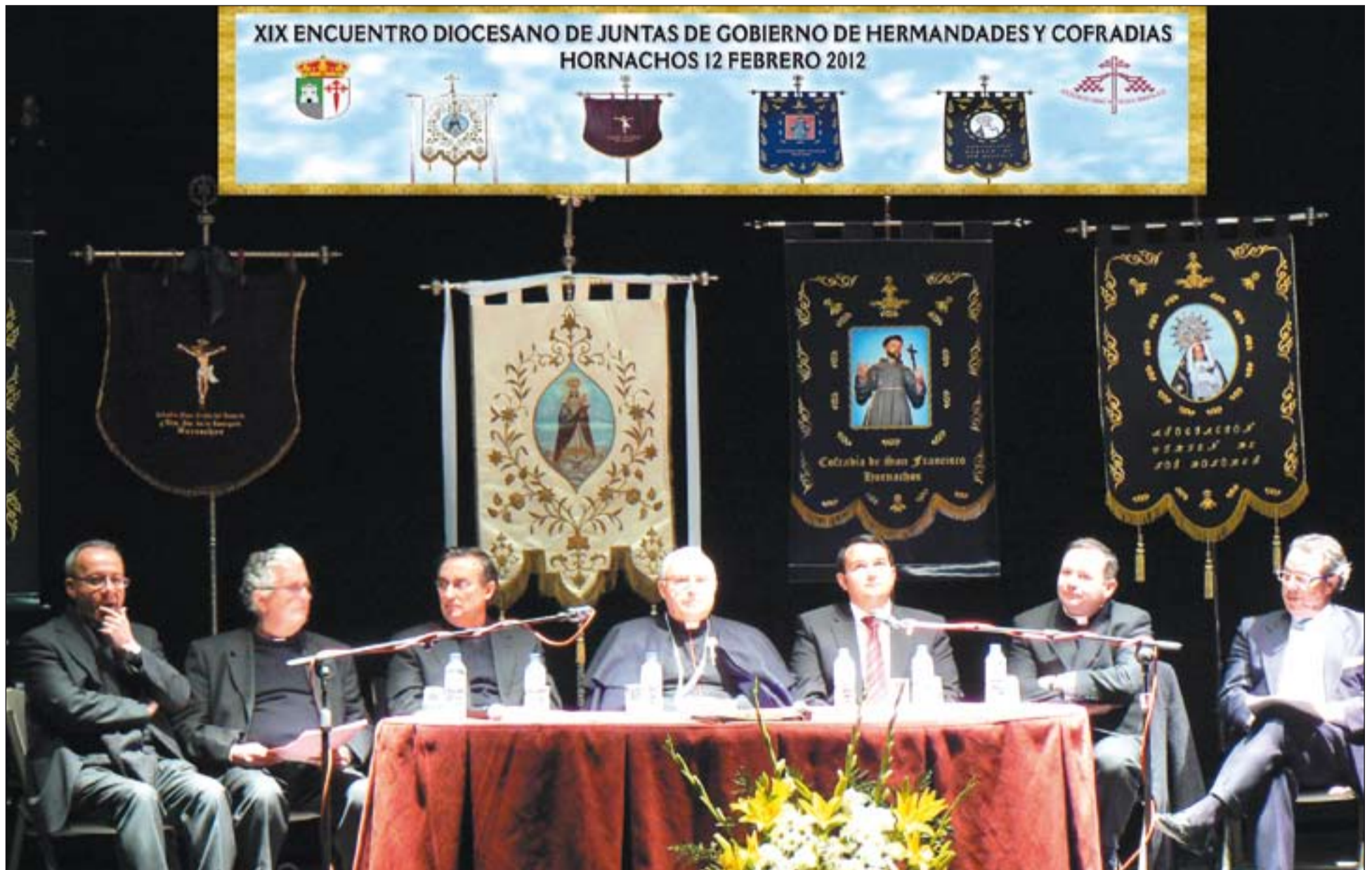
El Arzobispo de Mérida-Badajoz, en el centro, presidió el Encuentro diocesano de Juntas de Gobierno de Hermandades y Cofradías.