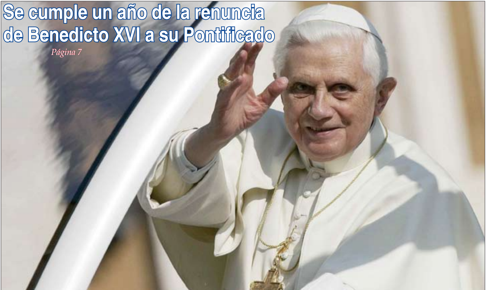
Benedicto XVI saluda desde el Papamóvil antes de su renuncia.