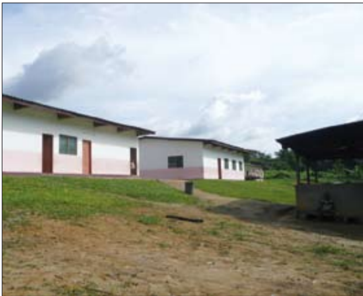
Foto de Archivo de un proyecto desarrollado en Ngovayang, Camerún.

No piden ninguna cuantía concreta y se propone la fi-