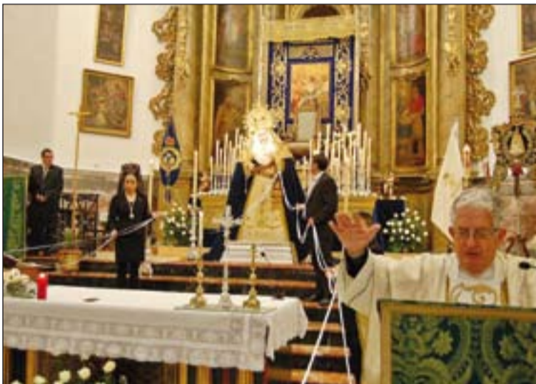
Momento de la Solemne Bendición de la Virgen de la Aurora.

también los niños de Primera Comunión y los abuelos, que al igual que Simeón y Ana, vieron con orgullo cómo sus nietos más pequeños eran presentados ante el Señor en medio de la comunidad cristiana.