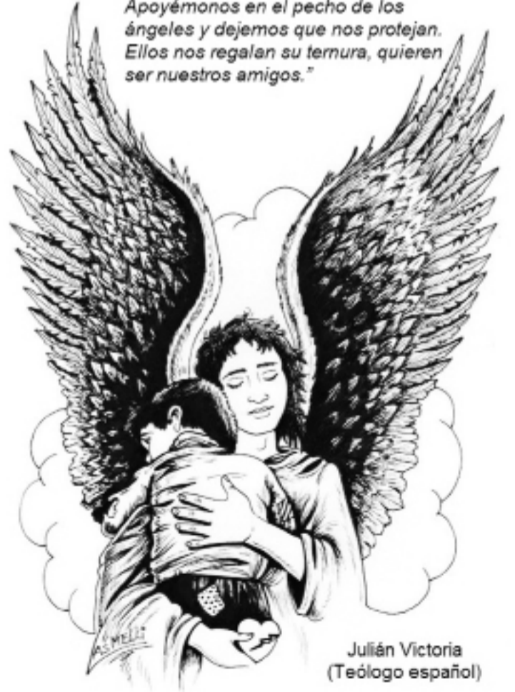
Julián Victoria (Teólogo español)

"Cobijémonos al abrigo de las alas angelicales, sintiendo el calor de su energía y su protección especial. Apoyémonos en el pecho de los ángeles y dejemos que nos protejan. Ellos nos regalan su ternura, quieren ser nuestros amigos."