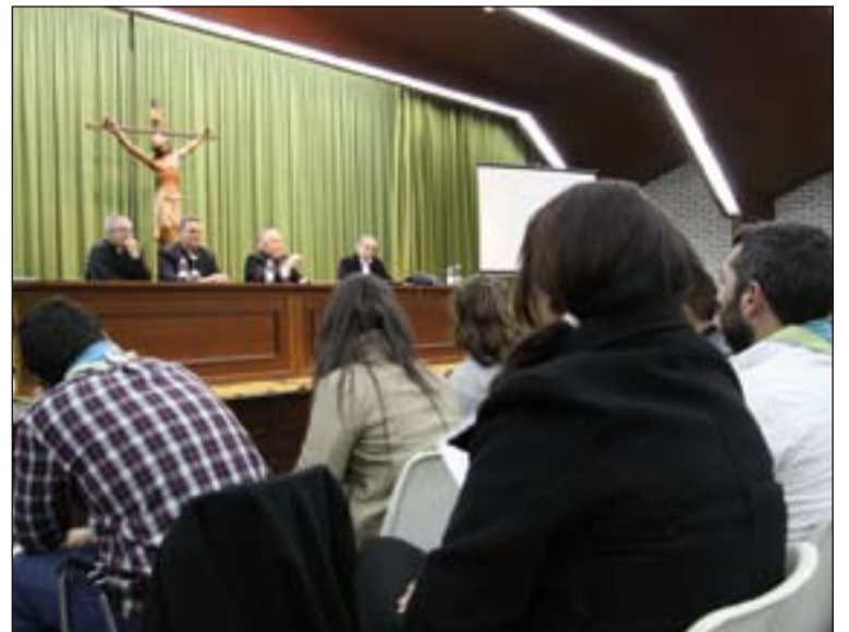
Entre los colaboradores estaba un nutrido grupo de jóvenes.

Don Santiago, que afirmó que la evangelización no solo es necesaria, si no que además es urgente y "un deber de justicia", dijo que es un proceso