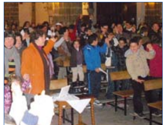
Momento de la oración solidaria celebrada en La Parra

la construcción de un nuevo modelo de sociedad.