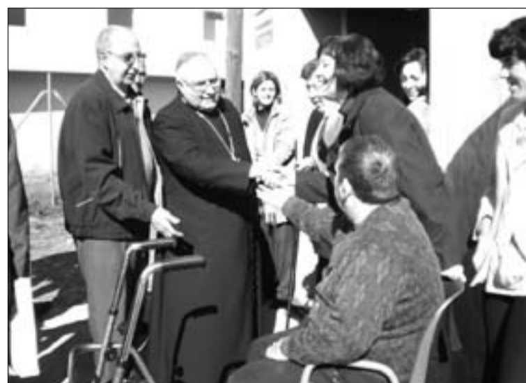
El Arzobispo visitó una asociación de minusválidos y discapacitados.