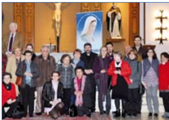
Voluntarios de Radio María

del voluntariado, así como sus líneas generales y promoción. El encuentro finalizó con la Eucaristía.