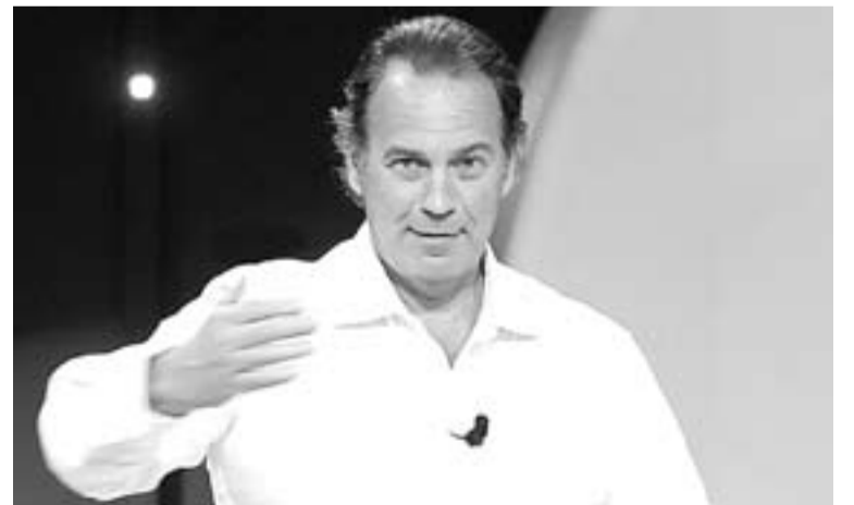
Bertín Osborne presenta "Un granito de arena"

El programa está muy bien llevado por Bertín Osborne, a quien podemos ver cómo consigue transmitir esa sensación de empatía que tiene con quienes entrevista. Es un profesional que cuenta con mucha experiencia y eso se nota. Se nota su afabilidad, su "saber hacer" en temas complicados y el cuidado con el que los trata, en definitiva, parece que el programa esté diseñado a su medida.