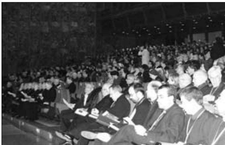
800 personas han participado en este congreso.

El programa, de carácter eminentemente divulgativo, ha conjugado ponencias en el Auditorio, la mayoría por la mañana, y conferencias simultáneas, destinadas a un público más reducido que se celebraban, sobre todo, por las tardes.