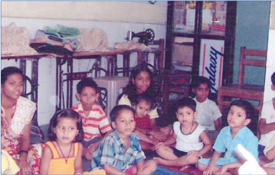
Manos Unidas de Mérida-Badajoz financiará tres proyectos en la India.

■ Se desarrollarán tres proyectos en la India, uno en Kenia, otro en República Democrática del Congo, en Senegal, Perú, Mali y Filipinas. En ellos se invertirán 437.514 euros procedentes de toda la Archidiócesis.