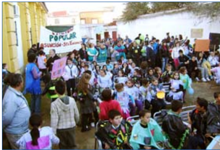
Actividad en la que han participado los niños.

La Misión es una acción extraordinaria de evangelización en la que se anuncia y celebra lo más nuclear de la fe cristiana. Entre los muchos actos que se celebran destacan los encuentros misioneros con niños y adolescentes, jóvenes y matrimonios, personas mayores y grupos. También durante la primera semana cobran especial importancia, además de la escuela de ora-