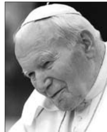
Juan Pablo II

La página web ofrece amplia documentación sobre el proceso de beatificación de Juan Pablo II, así como iniciativas que surgen en el mundo, y la oración para implorar gracias a través de la intervención del futuro beato. Zenit.org