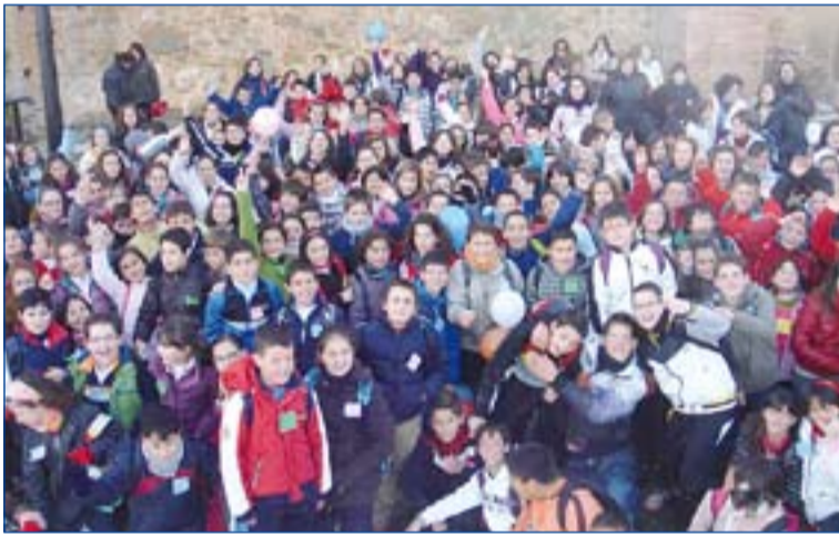
Niños participantes en el proyecto "Navegantes"

En esta jornada de convivencia se conocieron todos los chavales que están embarcados en el proyecto "Navegantes" y profundizaron en la verdadera alegría, que está en la amistad con Jesús, en una relación continua y asidua con Él.