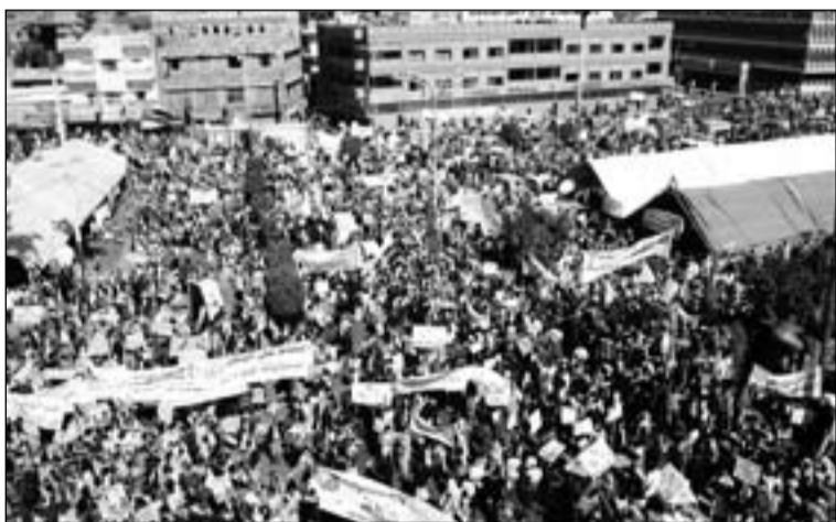
Manifestantes en Egipto.

El Papa, tras la oración del Ángelus del domingo, hizo un llamamiento a la paz en Egipto, asegurando que sigue "con atención la delicada situación de la querida Nación egipcia".