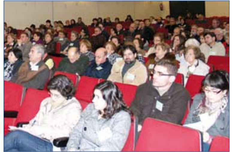
Laicos participantes en una Jornada de Formación.

Algunas de las pistas concretas de su reflexión fueron: los laicos extremeños estamos llamados a ser testigos de la esperanza y no profetas de calamidades, recuperando la misericordia en este mundo cambiante, rescatando el valor de