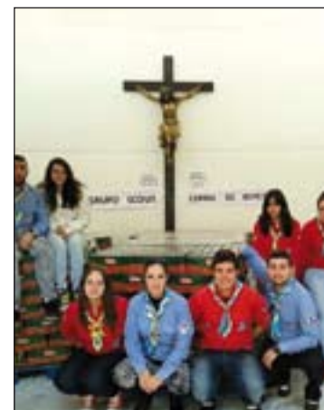
Miembros del grupo scouts.

Al ser preguntados por el motivo que les llevaba a estar allí trabajando, aún cuando todos tenían exámenes que preparar para esa semana, uno de los chicos scouts contestó que "...porque el otro es mi hermano".