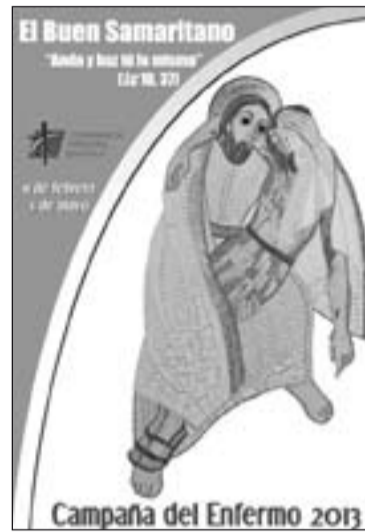
Cartel de la campaña del Enfermo.

Además, la Iglesia está presente en los hospitales de la diócesis con capellanes y voluntarios que dedican su tiempo libre a acompañar a muchos