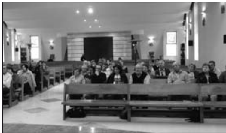
Los peregrinos, durante una celebración.

A modo de resumen, elegimos una frase de la última