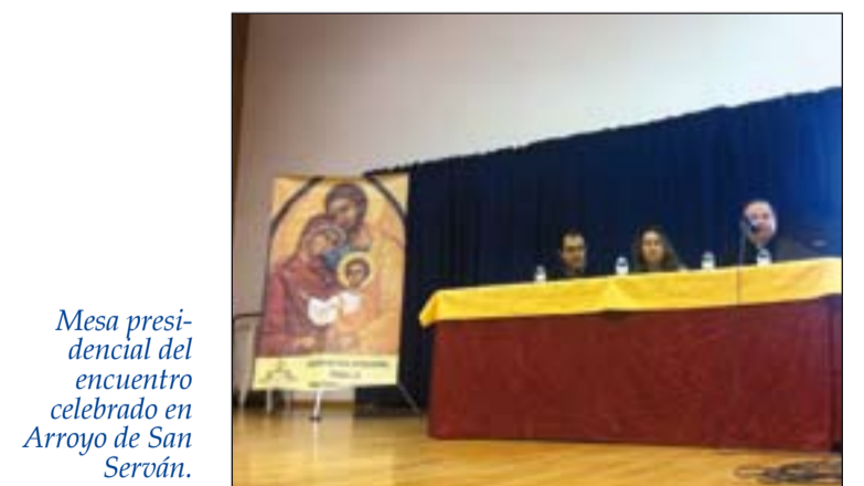
Mesa presidencial del encuentro celebrado en Arroyo de San Serván.

Esta Delegación celebraba a finales de enero en Arroyo de San Serván, un encuentro para agentes de pastoral familiar donde se trataron distintos temas sobre los cursos de preparación al matrimonio y se expusieron distintas experiencias,