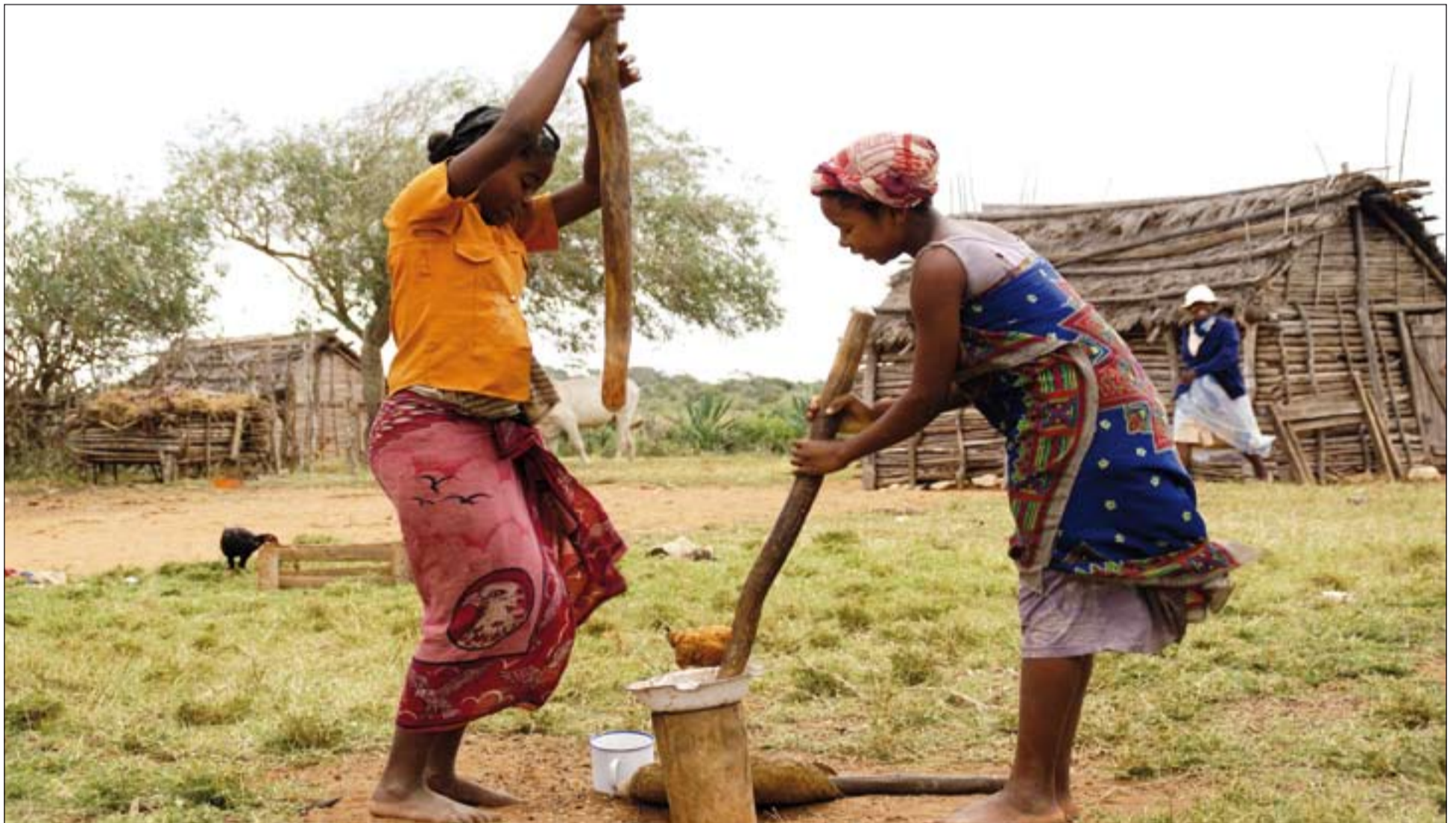
Mujeres de Madagascar.