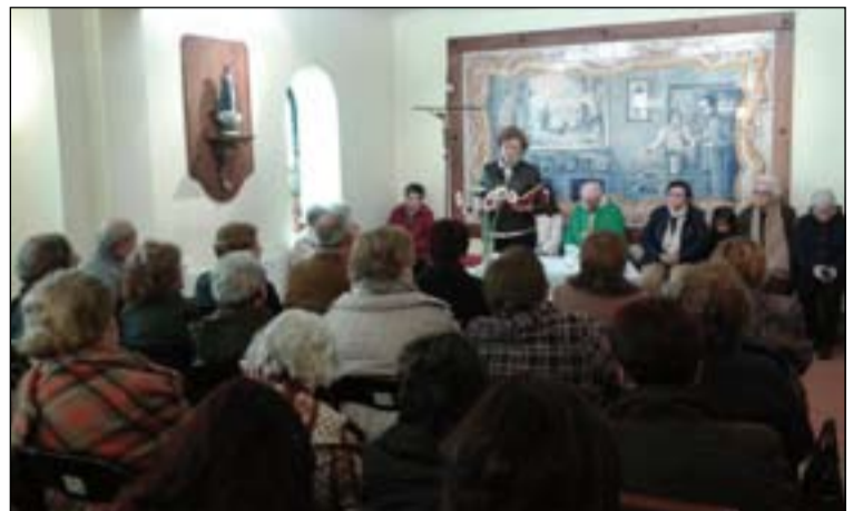
Los participantes celebraron la Eucaristía.