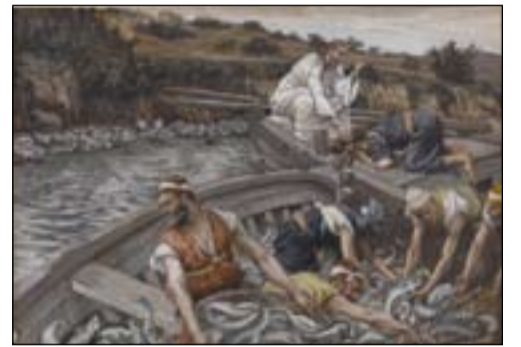
La pesca milagrosa. James Tissot (1886-1894). Museo de Brooklyn (Nueva York).

◆ 1 Cor 15, 1-11. Esto es lo que predicamos; esto es lo que habéis creído.