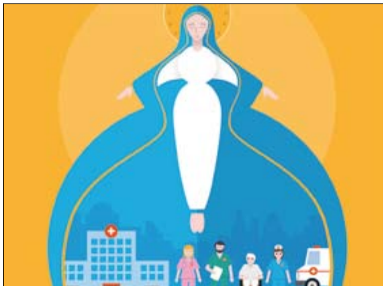
Cartel de la Campaña del Enfermo.

El día 11 de febrero, festividad de la Virgen de Lourdes, se celebra la Jornada Mundial del Enfermo y se inicia la Campaña del Enfermo, que se prolonga hasta el 1 de mayo, sexto domingo de Pascua, día en que se celebra la Pascua del Enfermo