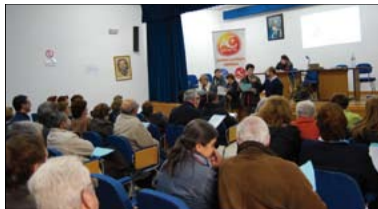
Arriba, el Arzobispo con los miembros de la Comisión diocesana. Abajo, encuentro diocesano del sector de Adultos (archivo).

la ACG de nuestra Diócesis han comenzado a trabajar los nuevos materiales, editados a nivel nacional, cuya columna vertebral es el Catecismo de la Conferencia Episcopal Es-