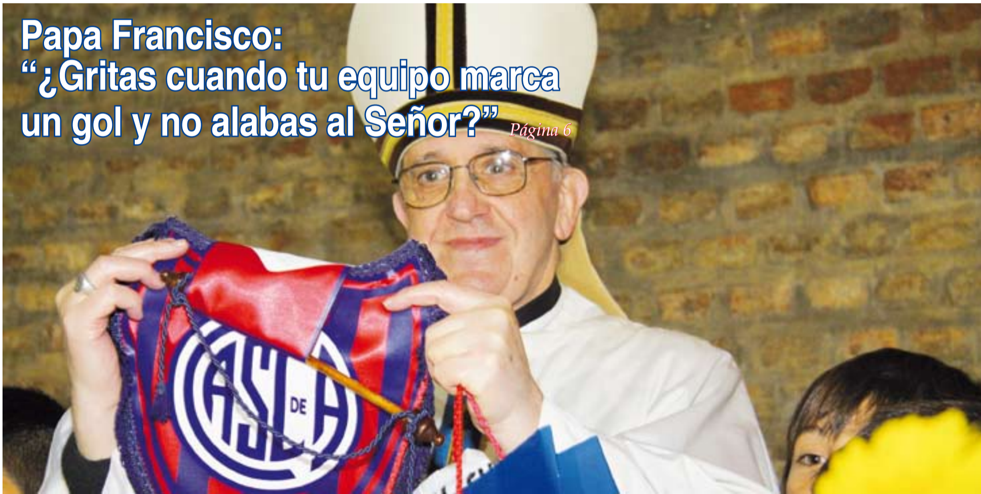
Papa Francisco con un banderín del San Lorenzo, equipo argentino del que es aficionado.

DVD “IMÁGENES DE LA FE” sobre la Catedral