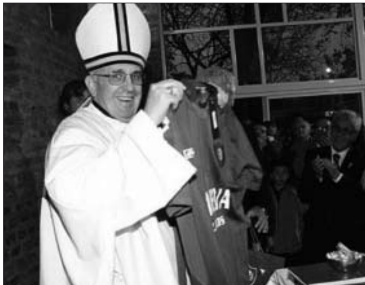
El Papa es un declarado seguidor del club San Lorenzo de Almagro.

Y de este modo lo explicó: "¡Pero, padre, esto es para los de la Renovación Carismática, no para todos los cristianos! No, ¡la oración de alabanza es una oración cristiana para todos nosotros! En la misa, todos los días, cuando cantamos el Santo. Esta es una oración de alabanza: alabamos a Dios por su grandeza, ¡porque es grande! Y le decimos cosas lindas, porque a nosotros nos gusta que sea así. 'Pero, padre, yo no soy capaz... Yo debo...' ¿Pero sos capaz de gritar cuando tu equipo marca un gol y no sos capaz de cantar alabanzas al Señor? ¿De salir un poco de tu compostura para cantar esto? ¡Alabar a Dios es totalmente gratuito! No pedimos, no da-