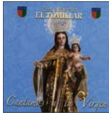
CD del colegio Virgen de Guadalupe ; abajo CD de El Tomillar .