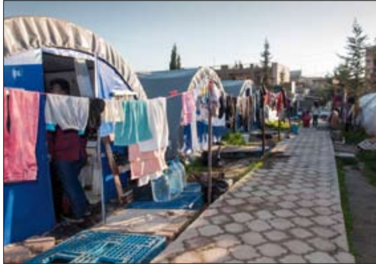
Centro de refugiados en barrio cristiano de Erbil, Irak.

Las dos nuevas entradas han echado fuera de la lista a Sri Lanka y Mauritania, que han sido rebasadas este año por el incremento de la persecución