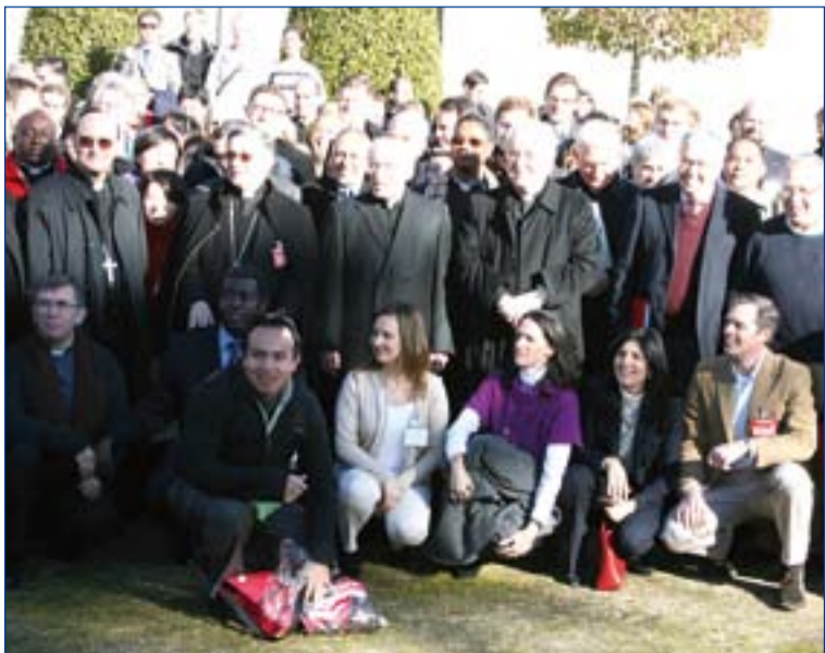
Encuentro preparatorio de la JM.

El viernes 19 se celebrará el Vía Crucis a lo largo del paseo de Recoletos. La Cruz de los Jóvenes recorrerá las 14 estaciones portada por jóvenes procedentes de países en los que la Iglesia se encuentra en dificultades.