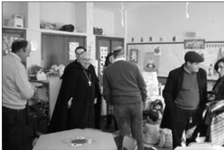
Visita al C.P. Nuestra Señora de Chandavila.

El Arzobispo continúa la Visita Pastoral que está realizando al arciprestazgo de Alburquerque y que, el pasado domingo, le llevó hasta La Codosera.