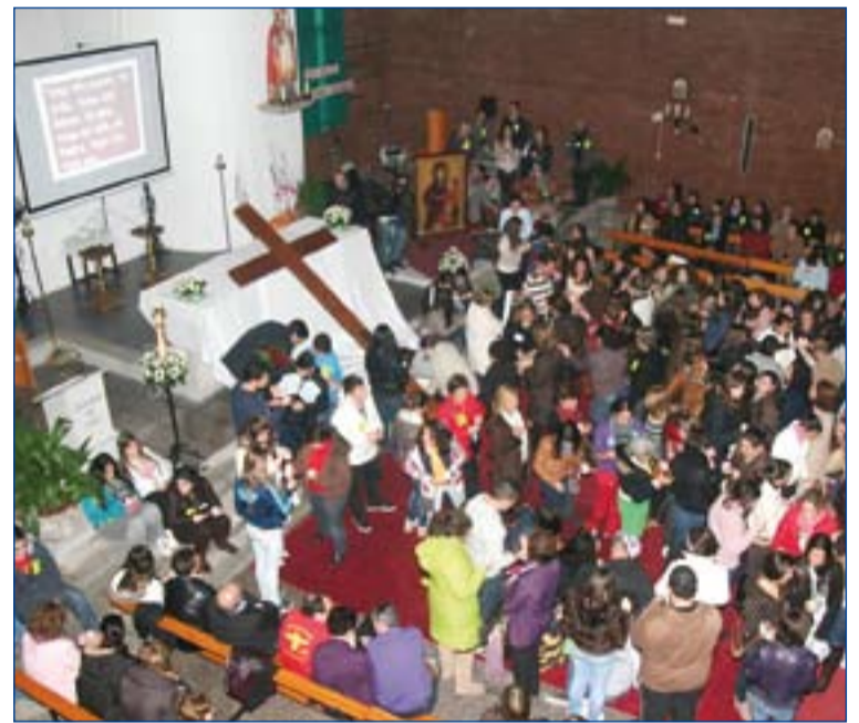
La Cruz y el Icono en Montijo.