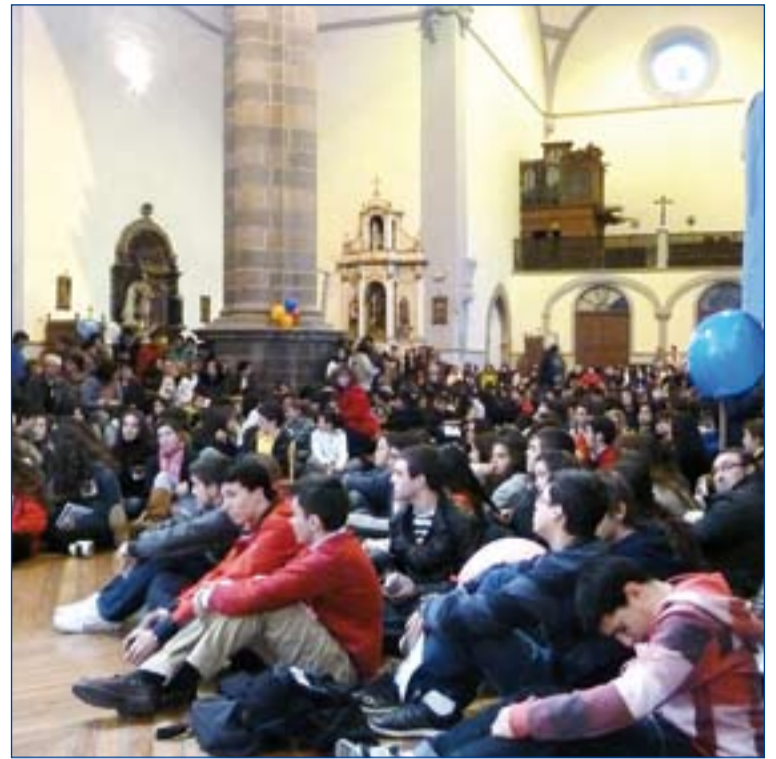
Encuentro en Zafra.

Nuestra apuesta de preparar algunas acciones importantes por zonas pretendía implicar a adultos y responsables de parroquias de todas aquellas comunidades que habían solicitado la presencia de jóvenes extranjeros. Nuestra intención en estos días era movilizar nuestras parroquias y comunidades, teniendo la experiencia de preparar juntos algo por y con los jóvenes y que esto sirviera un poco de entrenamiento para lo que va a venir en verano. Ambas cosas, al final, lo que pretenden es que animadores y catequistas de cada zona sientan la llamada del Padre para trabajar con los jóvenes, descubran que no están solos, que pueden hacerlo con otros, es una experiencia de trabajo con otros coordinados para ofrecer a los jóvenes la posibilidad del encuentro con Cristo. Esto es lo que pretendemos y hemos tenido esta posibilidad