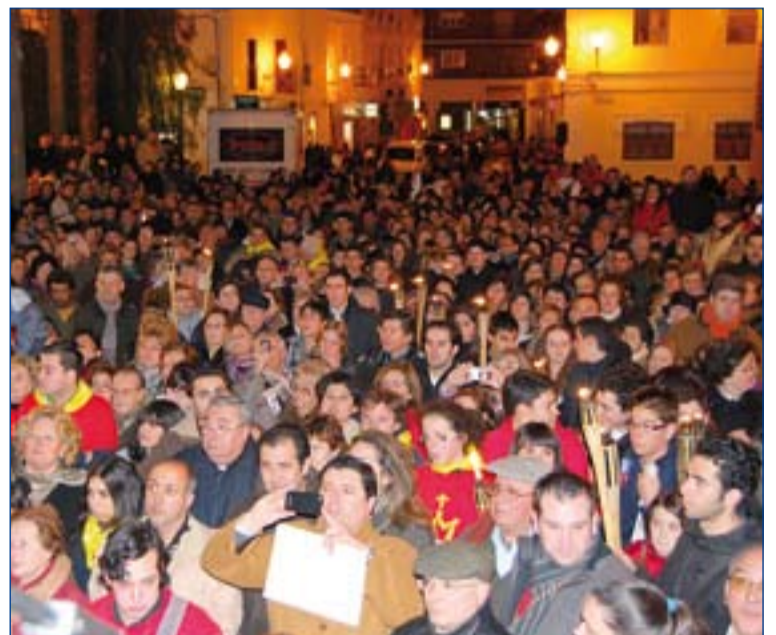
Despedida en Mérida.

apoyándonos en las zonas que ya estaban coordinando a animadores que trabajan con jóvenes y la hemos enriquecido con gente procedente de otras parroquias para organizar esta experiencia.