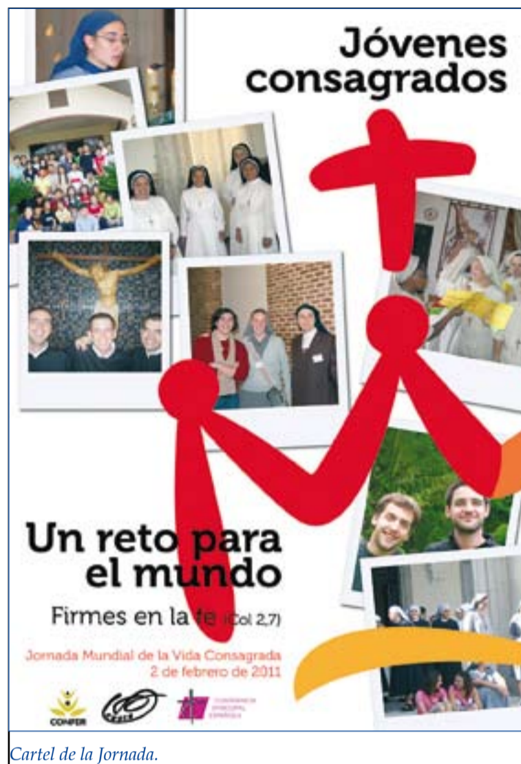
Cartel de la Jornada.