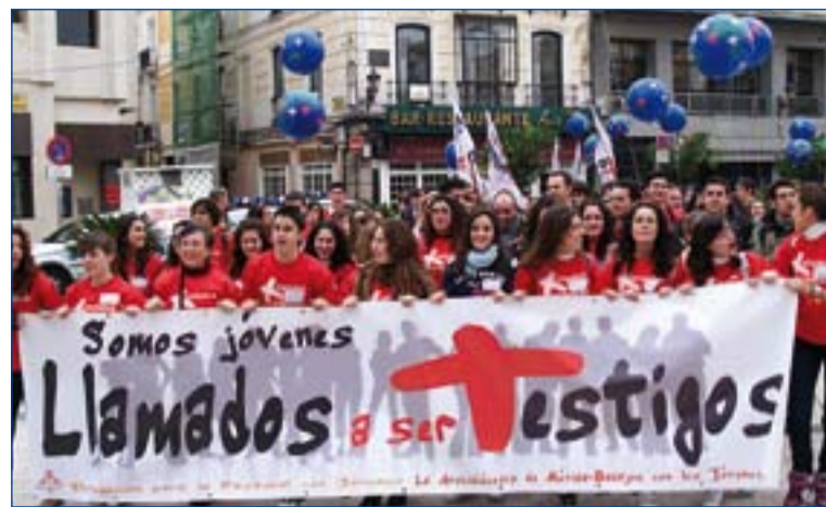
Jóvenes a su llegada a la Catedral, portando la Cruz de la JM.

En esta segunda parte los obispos hacen también un llamamiento al crecimiento mediante la propia superación y confiesan que "A los obispos nos preocupa vuestro presente