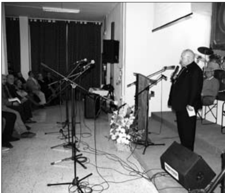
Monseñor Santiago García Aracil.

El acto estuvo escalonado por la intervención de un coro y un solista de la Iglesia de Fi-