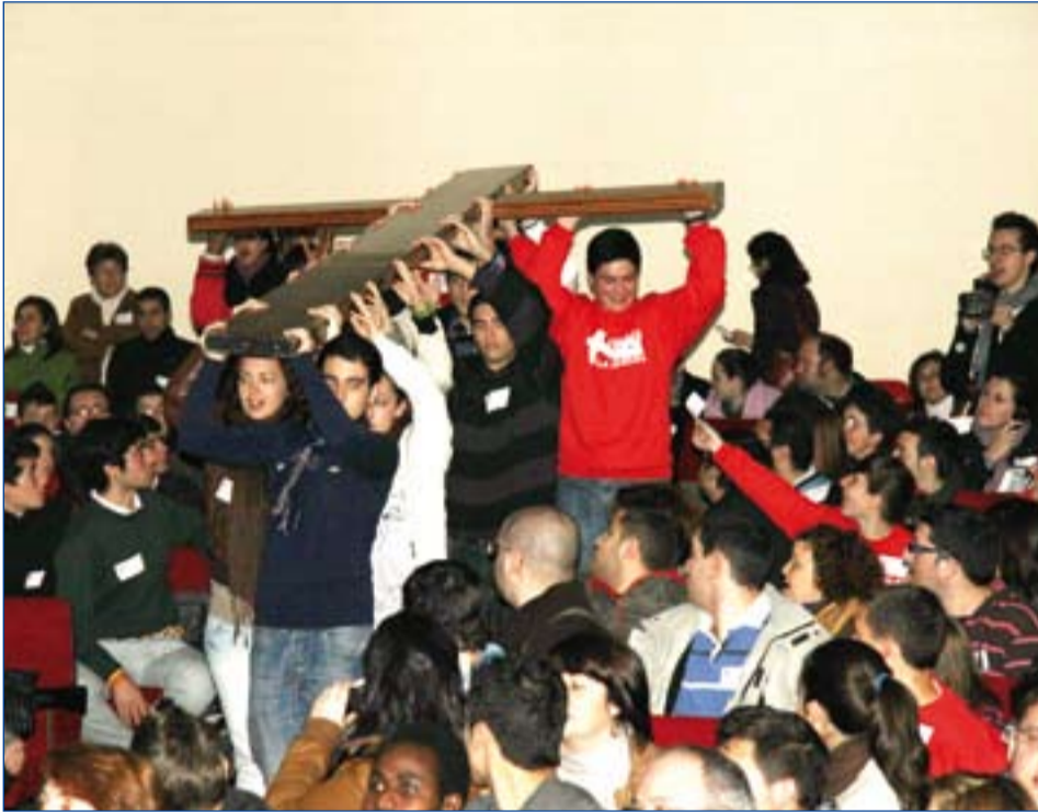
Arriba, jóvenes portando la Cruz en el encuentro diocesano celebrado en el colegio Salesiano de Badajoz. A la derecha, el Icono de la Virgen llevado por las calles de Zafra.

■ Los tres obispos de Extremadura han dirigido una carta a los jóvenes con motivo de la Jornada Mundial de la Juventud (JMJ).