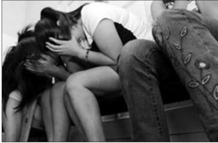
Muchas mujeres son traídas a España engañadas por mafias, que luego las obligan a prostituirse.

El informe muestra una fotografía detallada de la situación de este grave delito en España. Para su realización se ha contado con la participación de distintas administraciones, organizaciones internacionales, sindicatos y entidades que forman parte de la Red Espa-