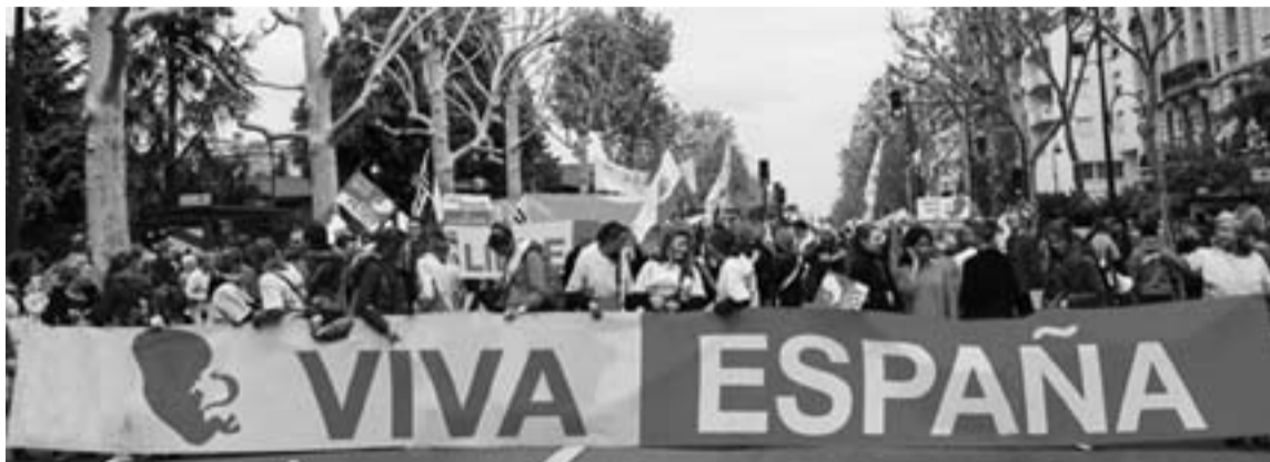
Los manifestantes apoyan la reforma de la Ley del aborto propuesta por Gallardón.

En el acto de París, intervino la Presidenta de la Fed-