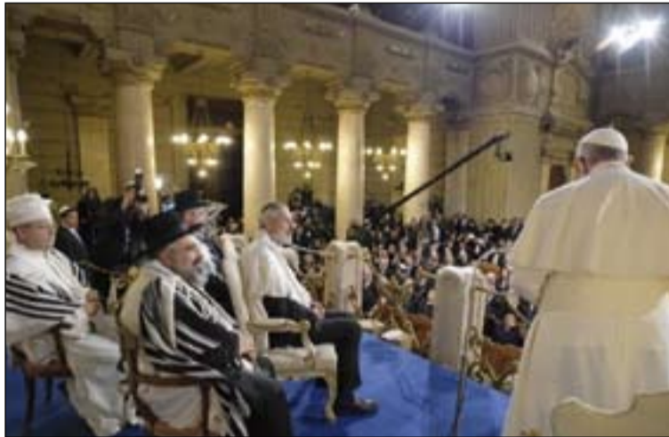
El Papa dirigió unas palabras en la Sinagoga mayor de Roma.

Siguiendo las huellas de san Juan Pablo II y del Papa emérito Benedicto XVI, el Papa Francisco visitó el pasado sábado la Sinagoga mayor de Roma para saludar a la comunidad judía de la capital, la más antigua del mundo