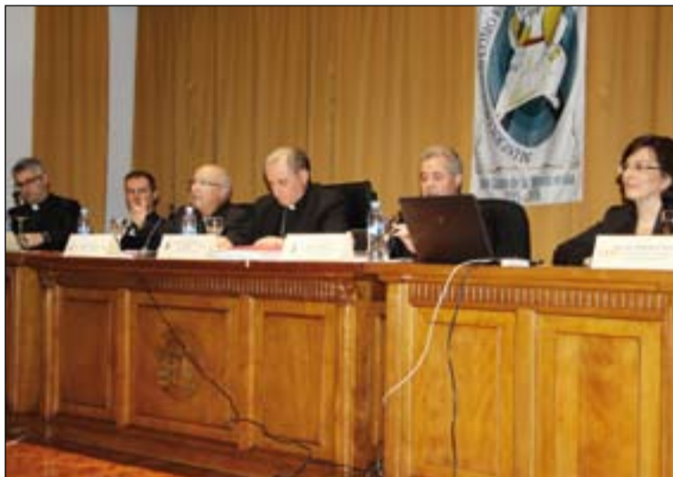
Mesa presidencial de esta Jornada.

Comenzó afirmando que "la educación afectivo-sexual coincide con la educación para el amor" y que "educar es ayudar