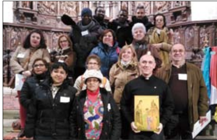
Participantes de la Diócesis en el encuentro.

200 personas participaron en el II Encuentro Regional de Migraciones en Cáceres, con la asistencia de migrantes que llegaron en autobuses desde Mérida, Badajoz, Plasencia, Don Benito o Coria. Fue el domingo 17 de enero, coincidiendo con la Jornada Mundial del Emigrante y Refugiado.