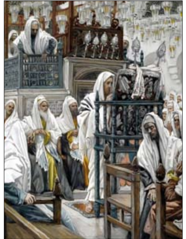
Jesús desenrolla el libro en la sinagoga (James Tissot).

«Hoy se cumple esta Escritura que acabáis de oír».