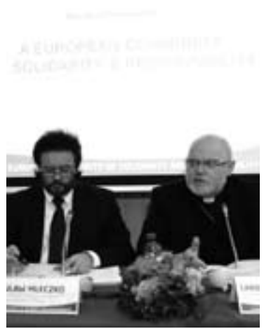
A la dcha., Cardenal Marx, Vicepresidente de COMECE.

Condenan sin embargo una economía volcada únicamente en el beneficio y que "amenaza con eclipsar las dimensiones social y ecológica de la ca-