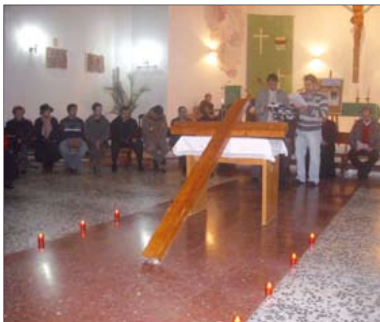
Celebración ecuménica en nuestra diócesis.