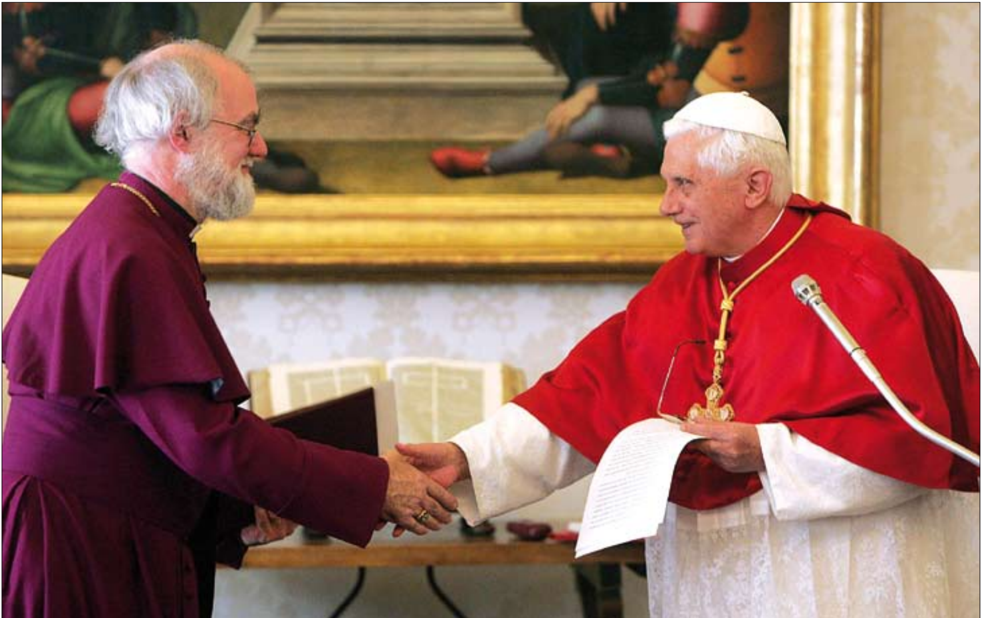
El papa Benedicto XVI con Rowan Williams, Arzobispo de Canterbury y Jefe de la Iglesia Anglicana.