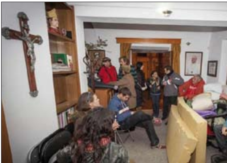
El encierro, previsto hasta el día 31, se prolongó hasta el 10 de enero.

Los activistas señalaban que no es posible que desde mayo que se aprobó la ley de la renta básica y desde septiembre que anunciaron que la iban a cobrar las primeras personas, a finales de diciembre