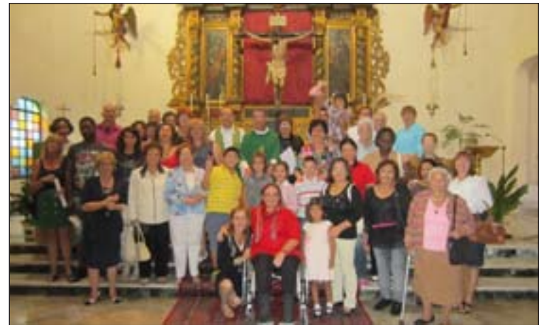
Participantes en la Misa sin Fronteras en Mérida.

Bajo el lema de la Jornada "Haciendo un mundo mejor" en la Archidiócesis de Mérida-