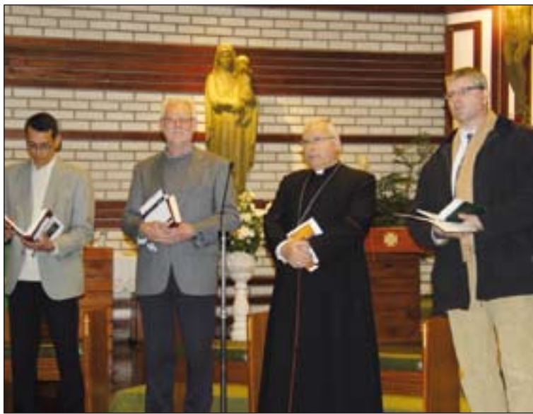
Oración por la unidad de los cristianos celebrada en la Parroquia de San José en Badajoz