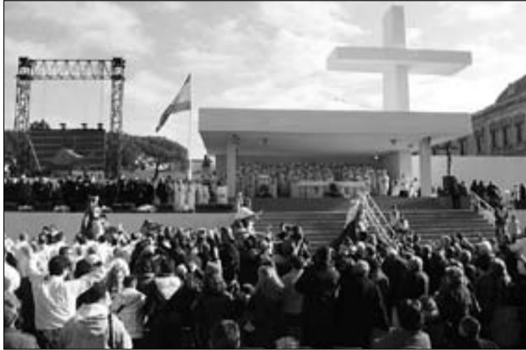
Numerosos obispos se dieron cita en el encuentro.

En su intervención el Papa dijo que "la mirada maternal de la Virgen, la amorosa protección de San José y la dulce presencia del Niño Jesús son