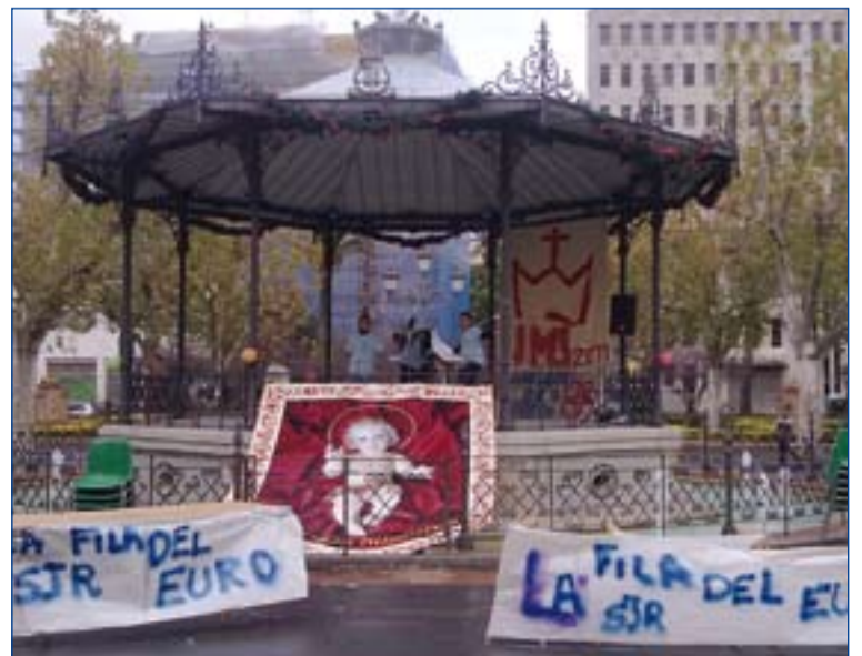
La plaza de San Francisco de Badajoz acogió el evento.

Un grupo de jóvenes de la parroquia de San Juan de Ribera, en Badajoz, han organizado la "Fila del Euro", en el parque de San Francisco de la capital provincial, para obtener fondos tanto para la Jornada Mundial de la Juventud (JMJ) y como para Cáritas. La actividad consistía en ir rellenando con monedas las siglas JMJ. Al mismo tiempo, y para los más pequeños, se desarrollaron diversos talleres de juegos. Finalmente se consiguieron recaudar 1.100 euros.