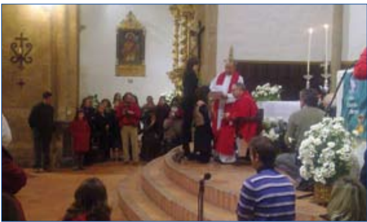
Celebración de la confirmación.