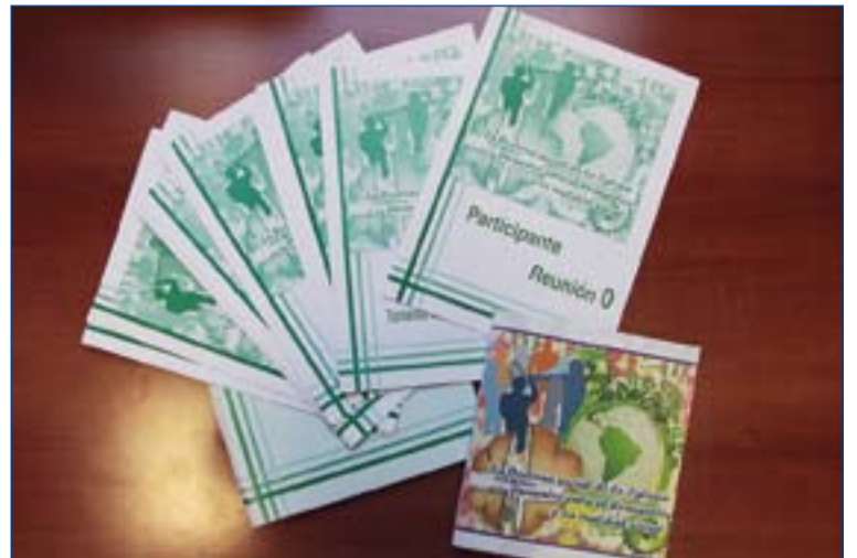
Materiales editados por el departamento de DSI.

El material, que se ha presentado bajo el título de "La DSI, encuentro entre el evangelio y la realidad social", está dividido en 8 temas, donde el primero "parte del análisis