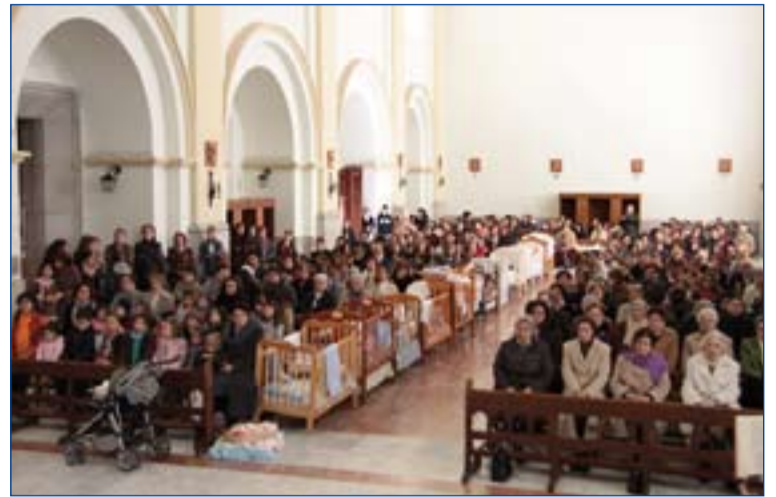
Eucaristía celebrada en San Juan Bautista.

Esta fiesta se ha celebrado en el marco de la Eucaristía que acogió la parroquia de San Juan Bautista de Badajoz, donde se dieron cita varios cientos de personas procedentes de los lugares de la diócesis donde está trabajando el Hogar de Nazaret -Fuente del Maestre, Llerena, Lobón o Ribera del Fresno, entre otros- y, también, de fuera de nuestra diócesis -como Brozas (Cáceres) o Salamanca-. En total se obtuvieron más de una veintena de cunas así como numerosas canastillas con ropa, enseres y accesorios para el