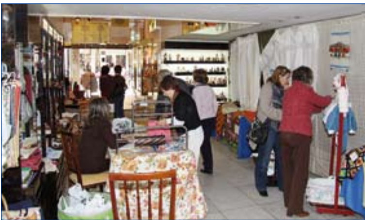
Vista del mercadillo solidario de este año.

Las instalaciones de esta parroquia también acogerán el próximo día 11 de enero, martes, un retiro para voluntarios y colaboradores de Manos Unidas, que será impartido por José Antonio Salguero, consiliario diocesano de dicha institución.