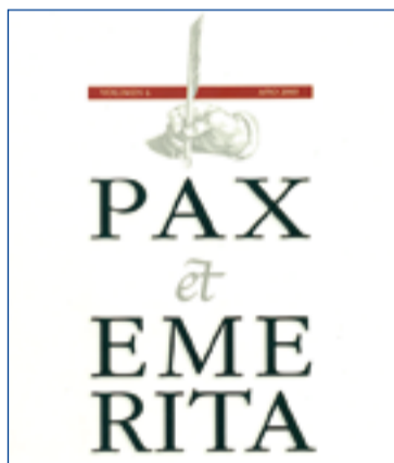
Portada de la revista.