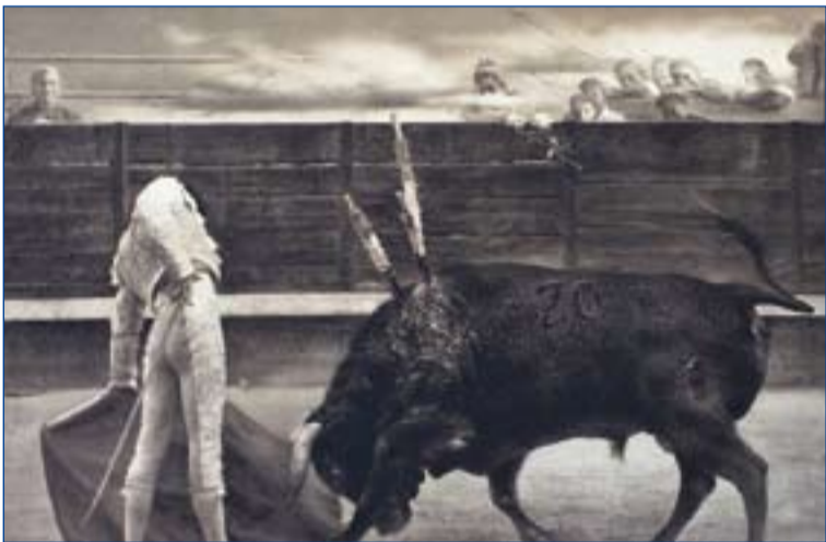
Imagen del grabado donado por Eduardo Naranjo.

Hasta el próximo día 10 aún es posible colaborar con esta campaña a través de su página web ( www.mochuelo.org ). Una vez cerrado el plazo, se procederá al reparto de los fondos obtenidos entre distintos organismos y asociaciones que trabajan con los más desfavorecidos.