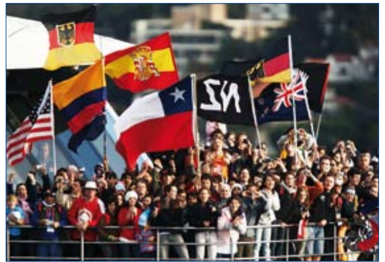
Jornada Mundial de la Juventud de Sydney.

Juan Pablo II quiso en el año 2003 que a la Cruz le acompañara este icono y lo entregó a los jóvenes. A partir de ese momento junto a la Cruz siempre camina la imagen de María,