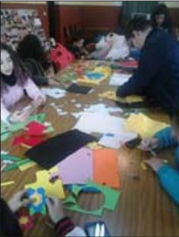
Niños y jóvenes realizan manualidades en el Taller solidario.

En una barra se sirvieron café y dulces. También hubo un mercadillo atendido por voluntarios en el que se vendieron artículos de artesanía realizados por los jóvenes de este centro juvenil, como pen-