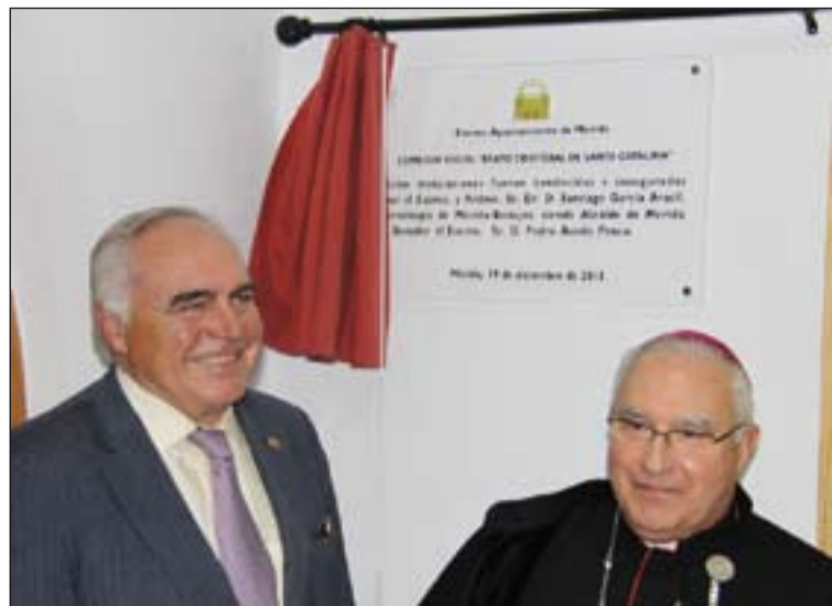
Don Santiago García Aracil, Arzobispo de Mérida-Badajoz y Pedro Acedo, Alcalde de Mérida, descubrieron una placa conmemorativa.

mó que “pocas veces hemos tomado una decisión en el Ayuntamiento con la que estemos más satisfechos como ésta de ceder al Arzobispado esta antigua hostería para este fin”.