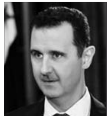
Al Asad, Presidente de Siria.

La entrega de este mensaje llega después de que el pasado 25 de diciembre el Santo Padre dedicara una particu-