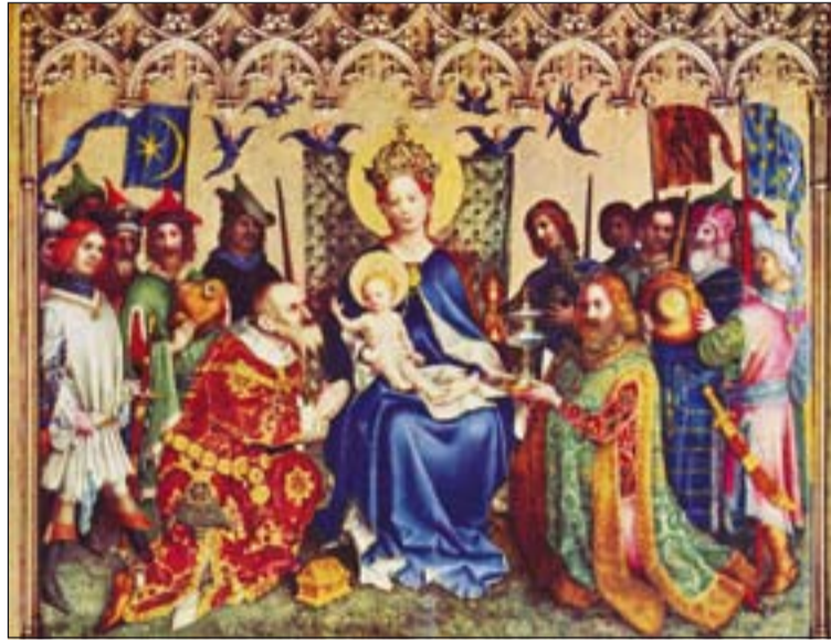
Tríptico de la Adoración de los Reyes en la Catedral de Colonia.

Podemos aprovechar esta fiesta de la Iglesia para re-