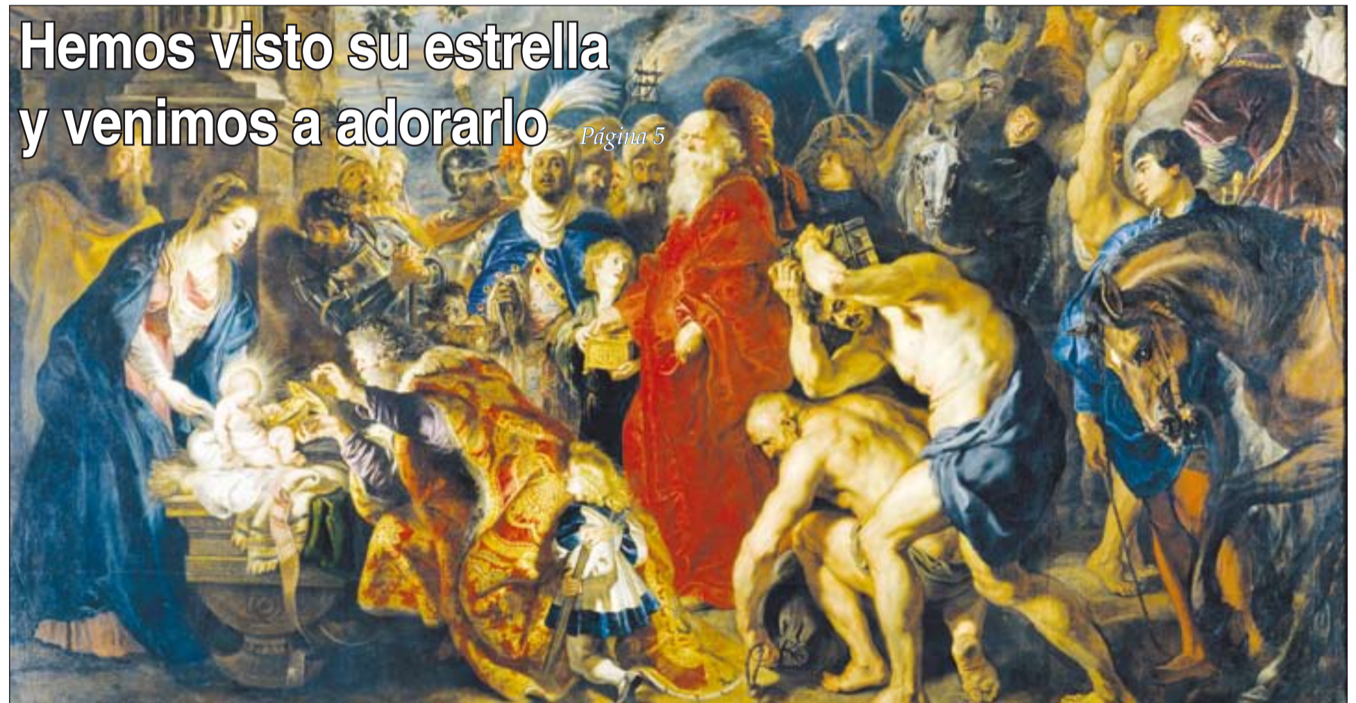
Adoración de los magos, de Rubens, en el Museo del Prado.

El comedor social Beato Cristóbal de Sta. Catalina ya funciona en Mérida dando de comer a 63 personas Página 4