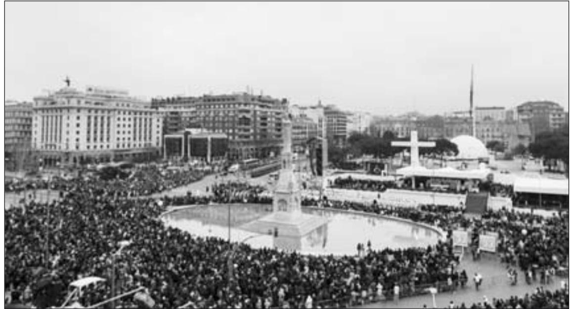
Jornada de la Familia en Madrid.

En su homilía en español y catalán, Monseñor Paglia pidió que "no se dejen solas